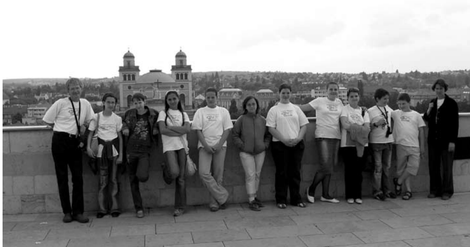
...és fent a várban.