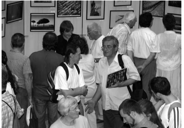
A fotókiállítás megnyitójának látogatói