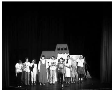
Az egri színpadon