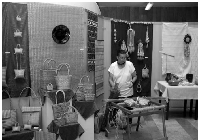
Gyékény és szalma tárgyak