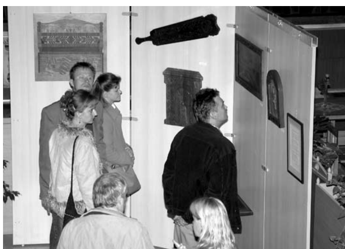
A kiállítás látogatói