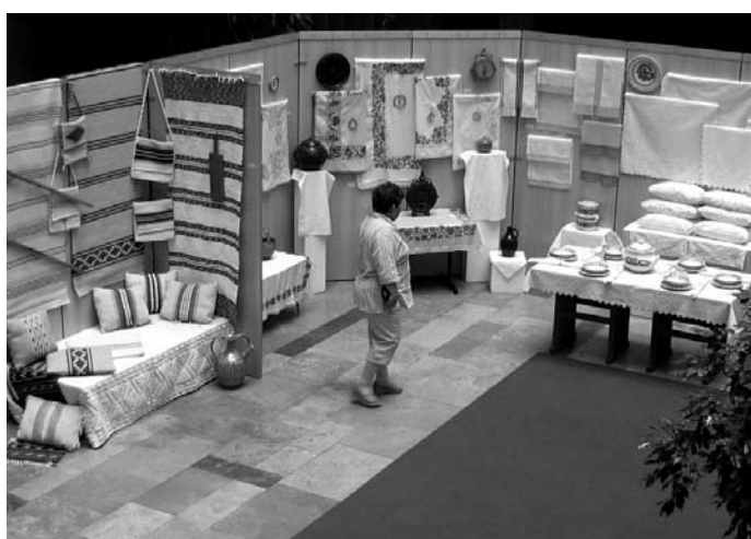
A kiállítás „madártávtól”