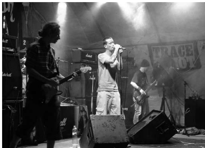
Good Time Boys zenekar

A hangulat az eddig években megszokott családias volt. A zenekarok saját bevallásuk szerint éppen ezért (is) szeretik ezt a helyet. Rendbontás idén sem volt. A nézők közt nagyon sok család volt, sokan egész apró gyerekekkel jöttek el, de idősebbek (40 felett) is szép számmal voltak.